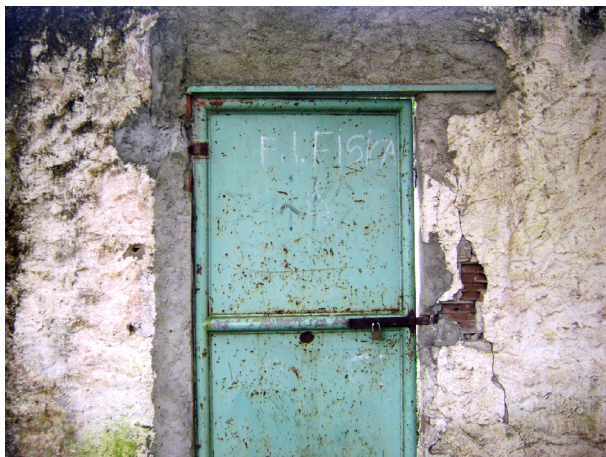
Imagem 02: Paredes furadas por projéteis com passagem para área de práticas físicas.

A escola tem boa estrutura física, mas carece de cuidados. Na verdade, precisa é de uma reforma mesmo. São tomadas de energia expostas e ao alcance das crianças, quadra sem traves e postes, refeitório com bancos sem assento, paredes descascadas e furadas por balas de revólver, estes, dentre outros fatores preocupam a segurança dos alunos da escola.